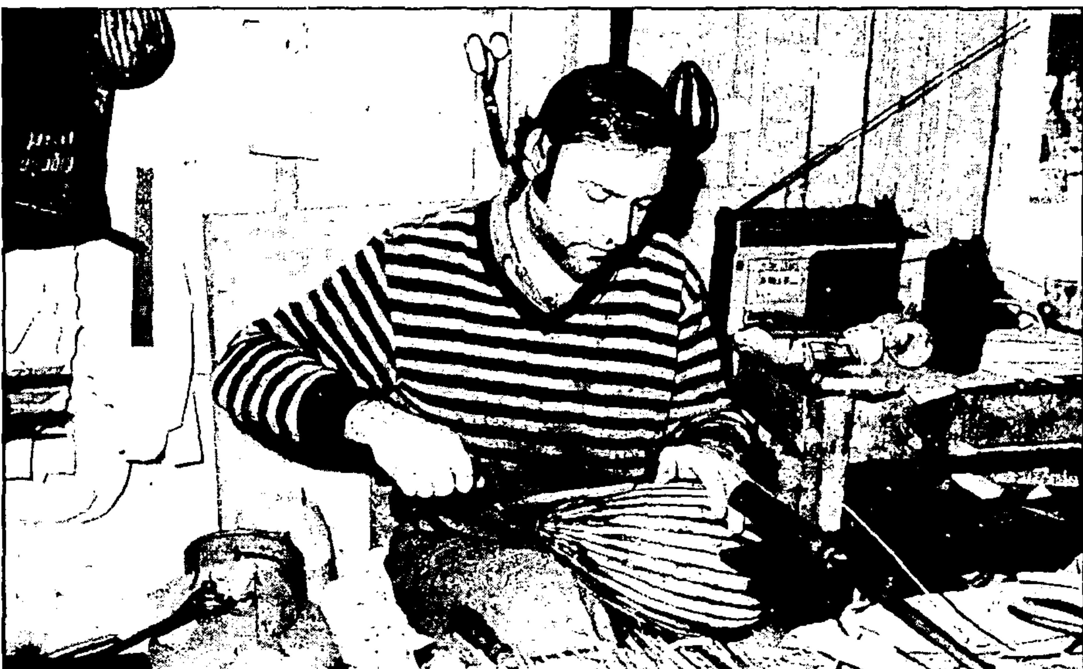
Μερικές επιδιορθώσεις και το «σκάφος» είναι έτοιμο