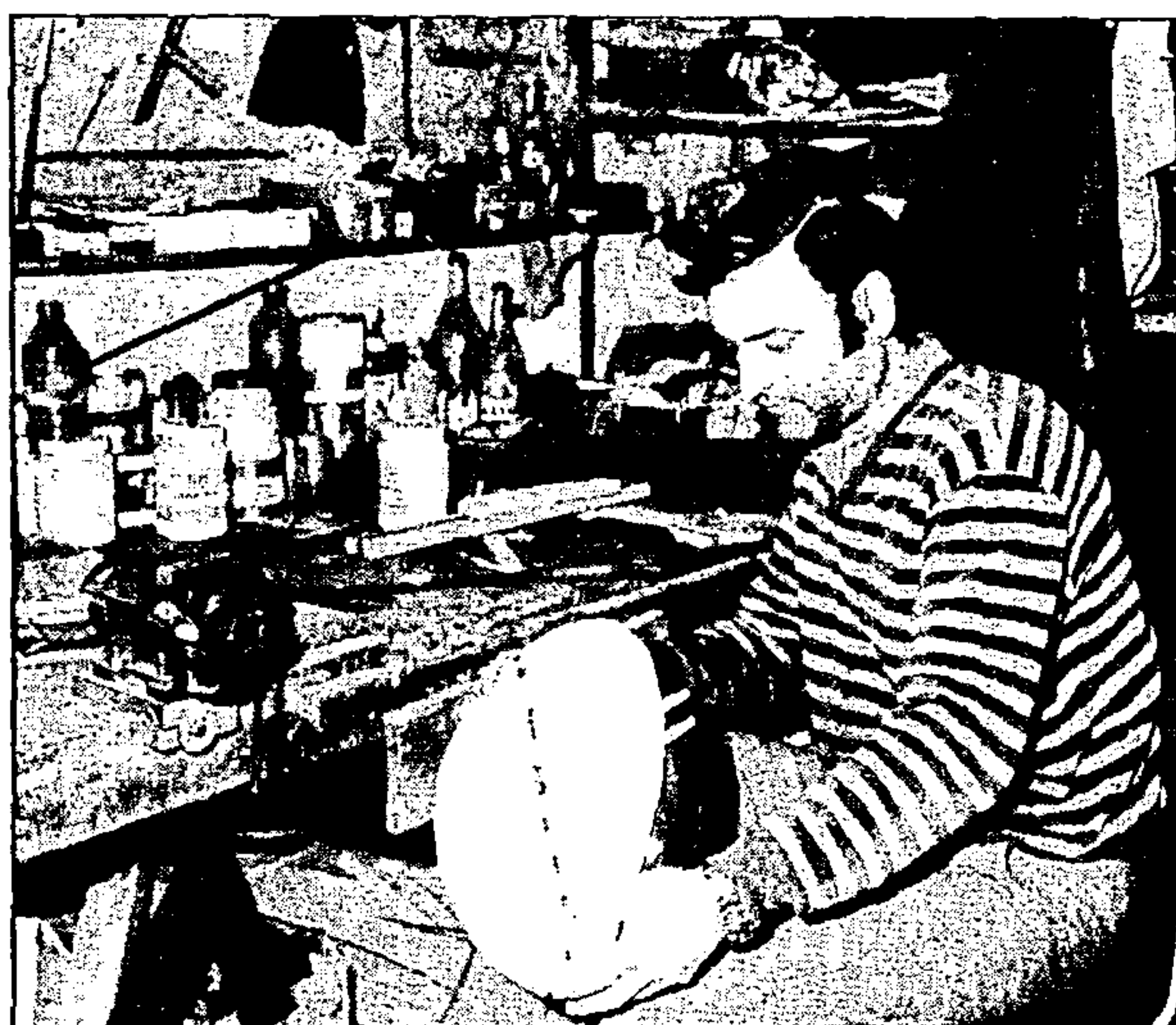
Το καπάκι, «το μεγάλο μυστικό», μπαίνει στη θέση του

Η κατασκευή του μπουζουκιού, του μπαλαμά, του τσουρά, του μαντολίνου του λαούτου και της κιθάρας είναι λίγο πολύ κοινή. Το σχήμα του σκάφους όπως λέγεται, εξαρτάται απ' το καλούπι. Αυτό για κάθε είδος έχει τις ανάλογες διαφορές πλάτος, μήκος, ύψος κλπ. Στο καλούπι προστίθεται ο