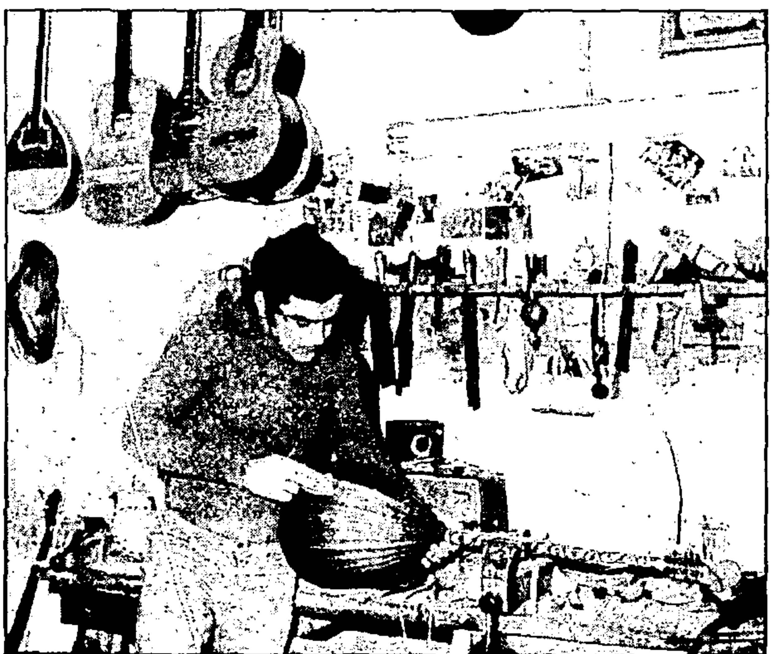
Στολισμένο πια, είναι έτοιμο για παράδοση

Το μπουζούκι και τα συναφή όργανα κατόρθωσαν να επιζήσουν. Κάποια όμως άλλα όργανα της λαϊκής μας παράδοσης εξαφανίζονται καθημερινά, μη έχοντας τουριστική αξία, επαγγελματικό σκοπό και κάποια κρατική μέριμνα. Το σαντούρι, το ούτι, η γκάιντα, η πίπιζα, η λίρα (κρητικιά και ποντιακιά) τα τουμπερλέκια, τα νταούλια, δεν έχουν πια έμπαιρα χέρια να τα φτιάξουν και αν μερικοί ασχολούνται ακόμα από μεράκι, πόσο θα ζήσουν; Οι δημοτικοί μας μουσικοί που γνωρίζουν την παράδοση και αξιοποιούν τις δημιουργίες των κατασκευαστών βρίσκονται απομονωμένοι, ανεκμετάλλευτη πηγή, κοντά στο τέλος της ζωής τους. Πιθανοί συνεχιστές της παράδοσης κάποια παιδιά που ψάχνουν στα σκοτεινά χωρίς το φως κάποιου αδειού ή σχολής, που θα τους διδάξει αυτό που αγαπάνε. Δ.Κ.