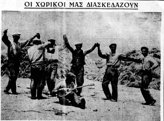
Γλέντι καὶ χορὸς χωριάτικος μετὰ τὴν ὄραν τοῦ τρυητοῦ