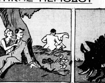
...τὸν ἀλεπούδαν (χαρτοκελτῶν)