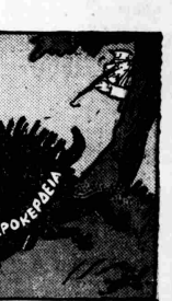
Τὸ ἀνηλεὲς κούρη τοῦ ἀγριοχοίρου