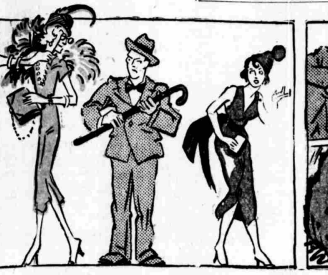
Τὸ κούρη τῆς εὐλόκοτας καὶ τῆς... πέρδικας